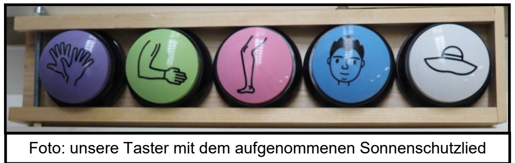
Foto: unsere Taster mit dem aufgenommenen Sonnenschutzlied

Gruppenübergreifend treffen sich die Kinder seit Anfang Mai an verschiedenen Tagen zu gemeinsamen Impulsen, die anschließend in der Gruppe weiter vertieft werden. Dabei erleben die Kinder das Thema auf vielfältige